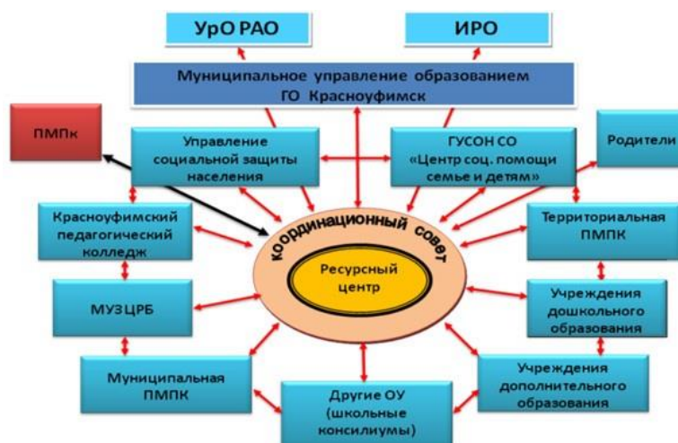
Рис. 3. Расширенная модель сопровождения детей с ОВЗ

В центре схемы находится ресурсный центр МАОУ ОШ № 4, созданный с целью методического сопровождения субъектов образовательной деятельности ГО Красноуфимск в работе с детьми с ОВЗ, а также для координации деятельности служб сопровождения школьных консилиумов и решения проблем комплексного и системного сопровождения детей с ОВЗ (табл. 3).