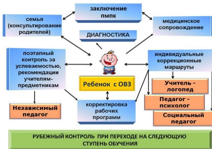
Рис. 2. Организационная модель комплексного психолого-педагогического сопровождения детей с ОВЗ в общеобразовательной школе специалистами школьной психолого-медико-педагогической комиссии

На практике разработана и реализована модель психолого-педагогического сопровождения детей с ОВЗ (рис. 2).