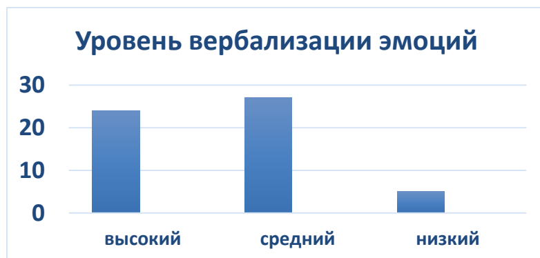
Рис. 1 Результаты диагностики

Проанализируем диагностические результаты, представленные в таблице. По методике «Словарь эмоций» мы выявили, что после проведения занятий для 24 младших школьников характерен высокий уровень эмоциональной идентификации, у 28 испытуемых средний уровень, у 5 детей низкий уровень. (см. рис.2)