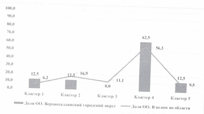
Трек 1. Верхнесалдинский городской округ