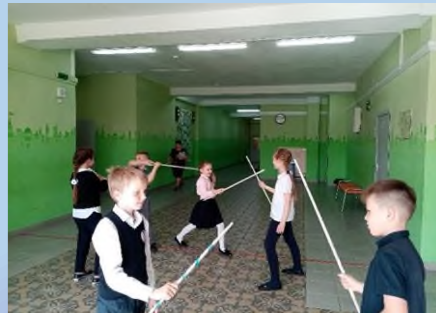
Упражнение «Битва на мечах»