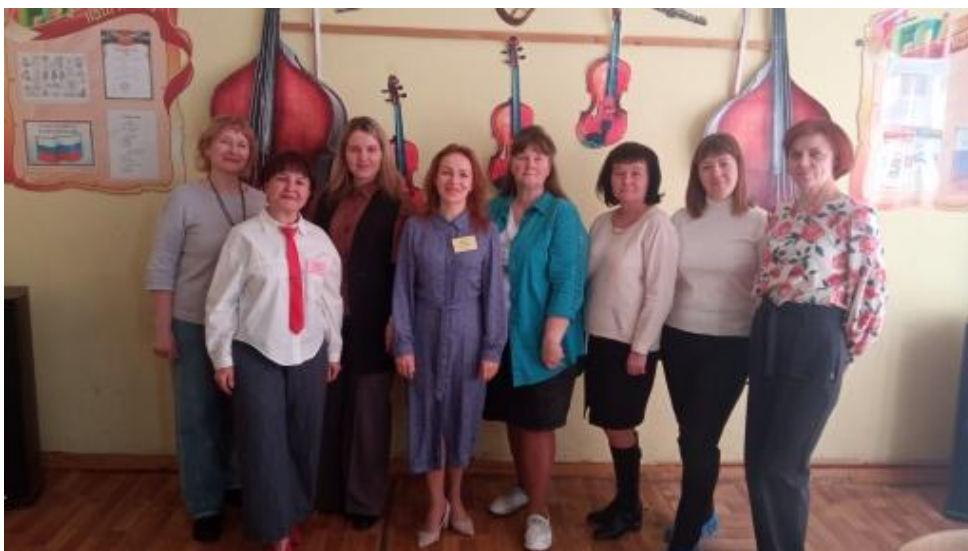
Единый методический день